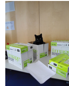
Abbildung 1) Leben in einem Karton.

\usepackage[ format=plain, indentation=1cm, labelformat=brace, labelsep=newline, textformat=simple, justification=centering, labelfont=Large,bf, textfont=it ]{caption} ... \begin{figure} \centering \includegraphics[width=0.5\textwidth]{bild} \caption{Leben in einem Karton.} \end{figure}