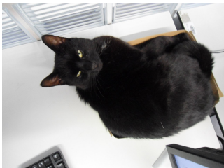
Abbildung 2) Keine Fotos!

\begin{minipage}[c]{0.45\textwidth} \includegraphics[width=0.8\textwidth]{bild2} \captionof{figure}{Keine Fotos!} \end{minipage} \begin{minipage}[c]{0.45\textwidth} \includegraphics[width=0.8\textwidth]{bild3} \captionof{figure}{Keine Fotos mehr!} \end{minipage}