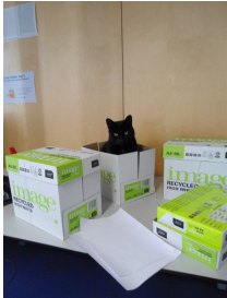
Abbildung : Leben in einem Karton.