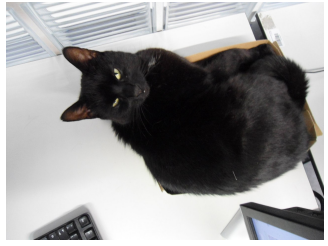
Abbildung : Keine Fotos!