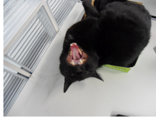
Abbildung 3) Keine Fotos mehr!